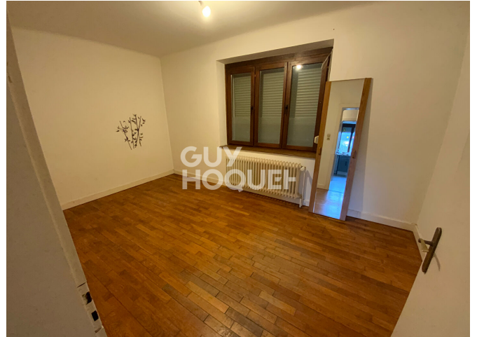
Photo du bien